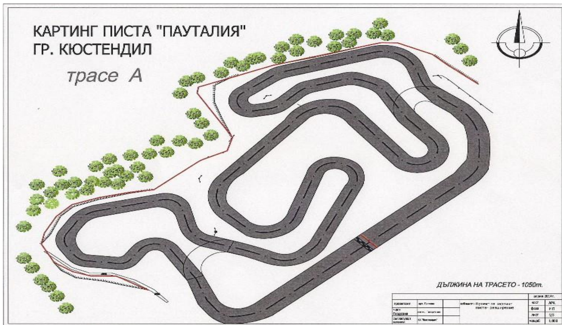
СХЕМА НА ТРАСЕТО