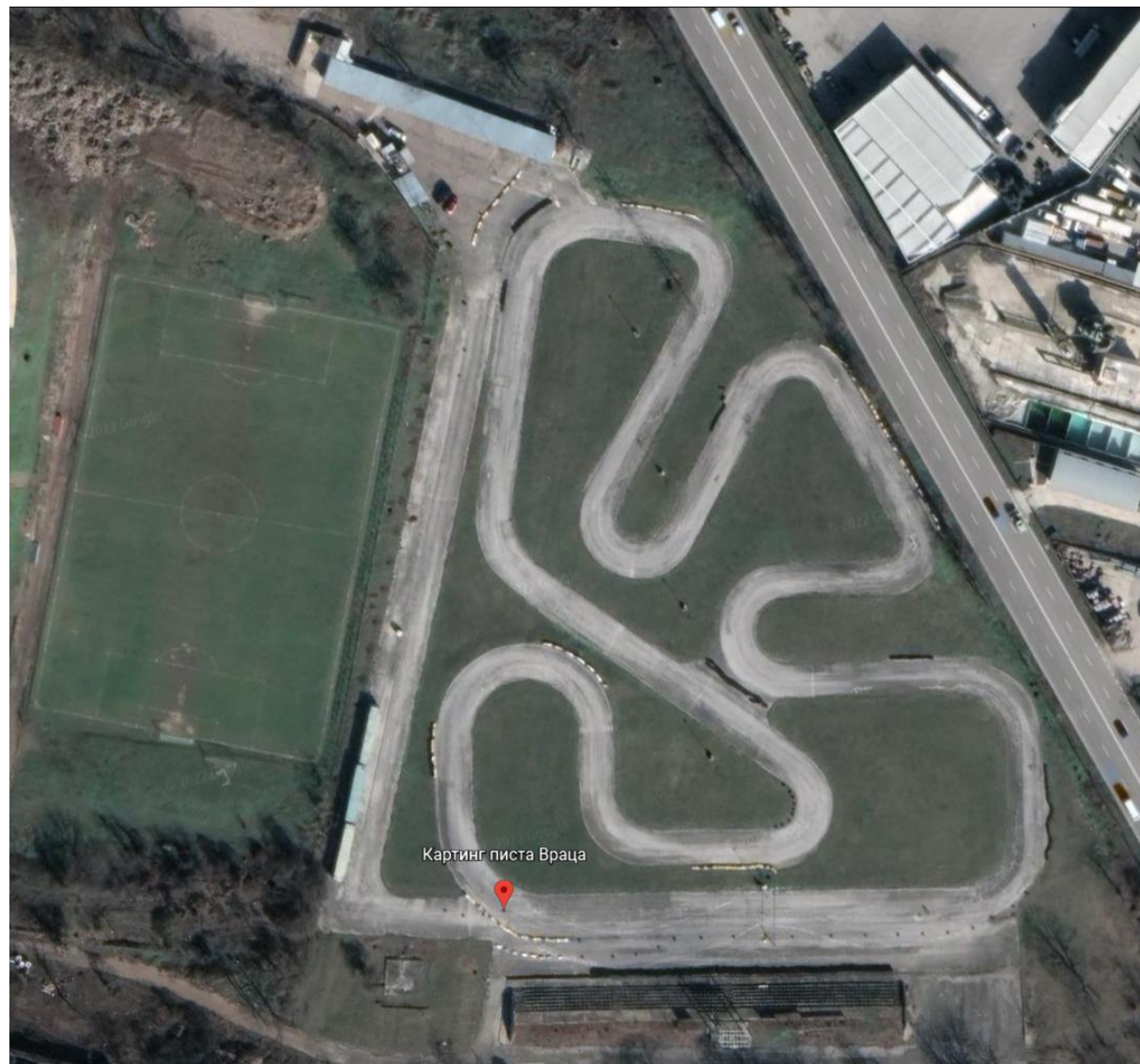
СХЕМА НА ТРАСЕТО