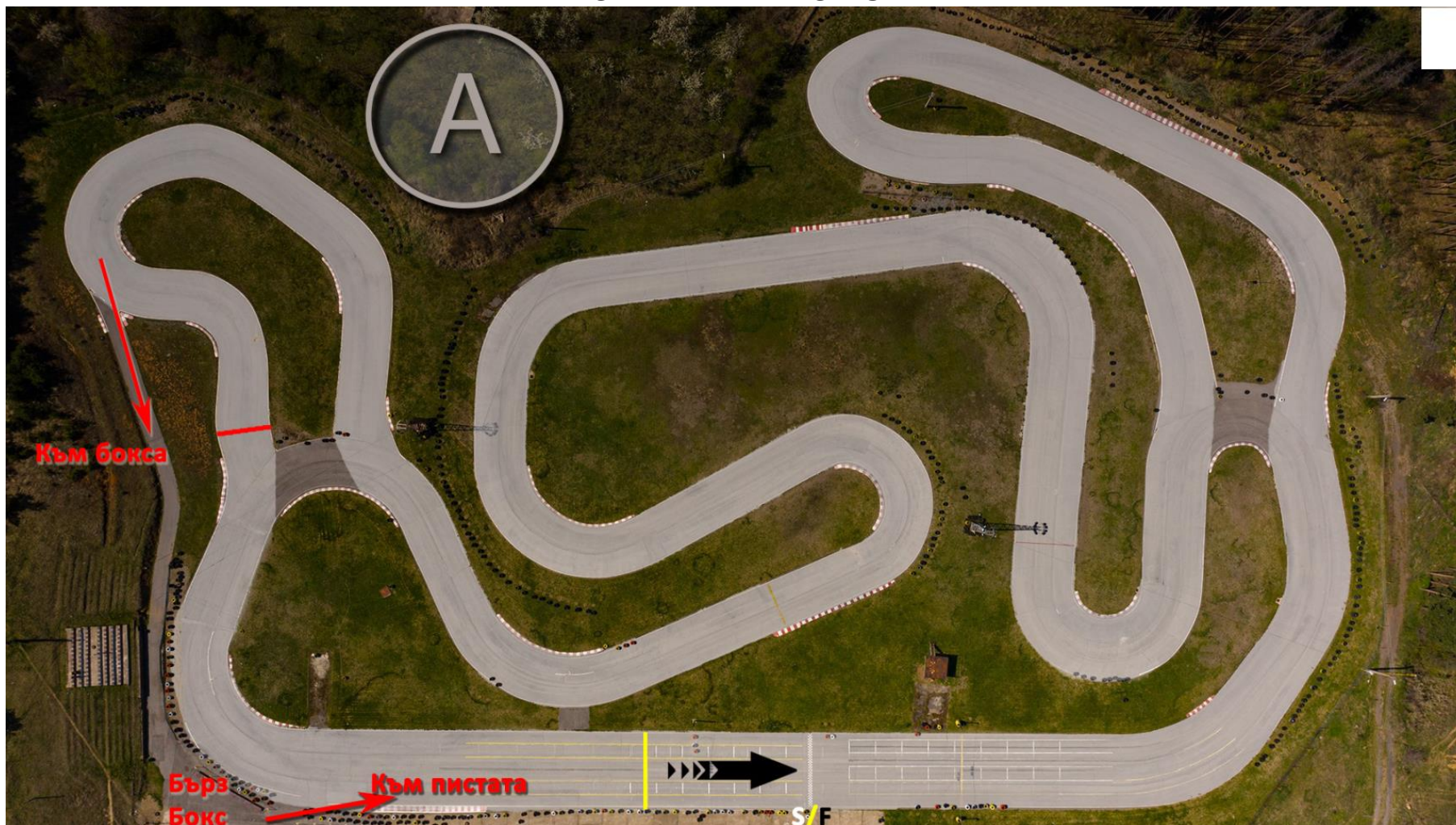
СХЕМА НА ТРАСЕТО